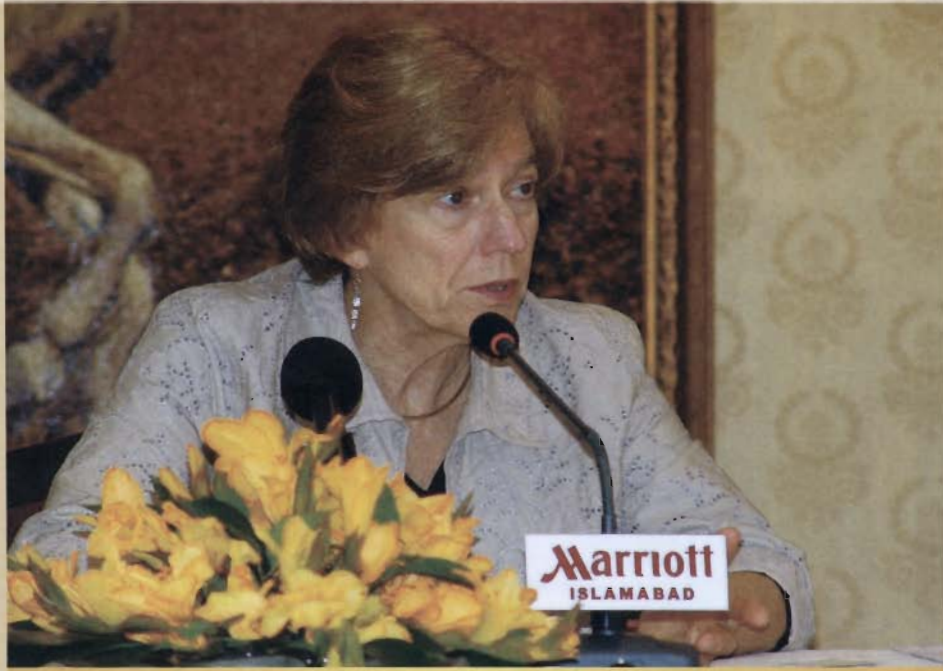
حکمرہ خارجی خصوصی مشیر برائے سائنس و ٹیکنالوجی ڈاکٹر نینا فیڈرروف 28 اگست کو اسلام آباد میں ایک پریس کانفرنس سے خطاب کر رہی ہیں۔