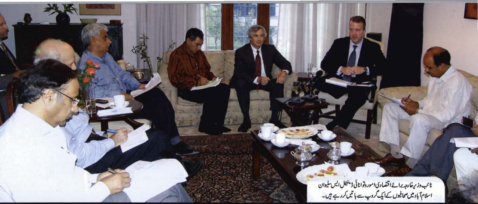
نائب وزیر خارجہ برائے اقتصادی امور ٹوٹاناٹی ڈینیل ایس سلوان اسلام آباد میں صحافیوں کے ایک گروپ سے باتیں کر رہے ہیں۔