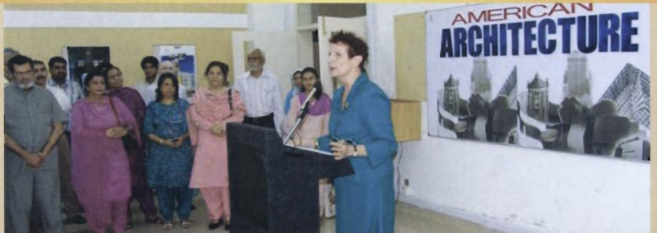
امریکی چپلر اتاشی کانسٹینس جوز 20 اگست کو کانسٹینس یونیورسٹی اسلام آباد میں امریکی فن تعمیر کے موضوع پر منعقد ہونے والی نمائش کی اختتامی تقریب سے خطاب کر رہی ہیں۔