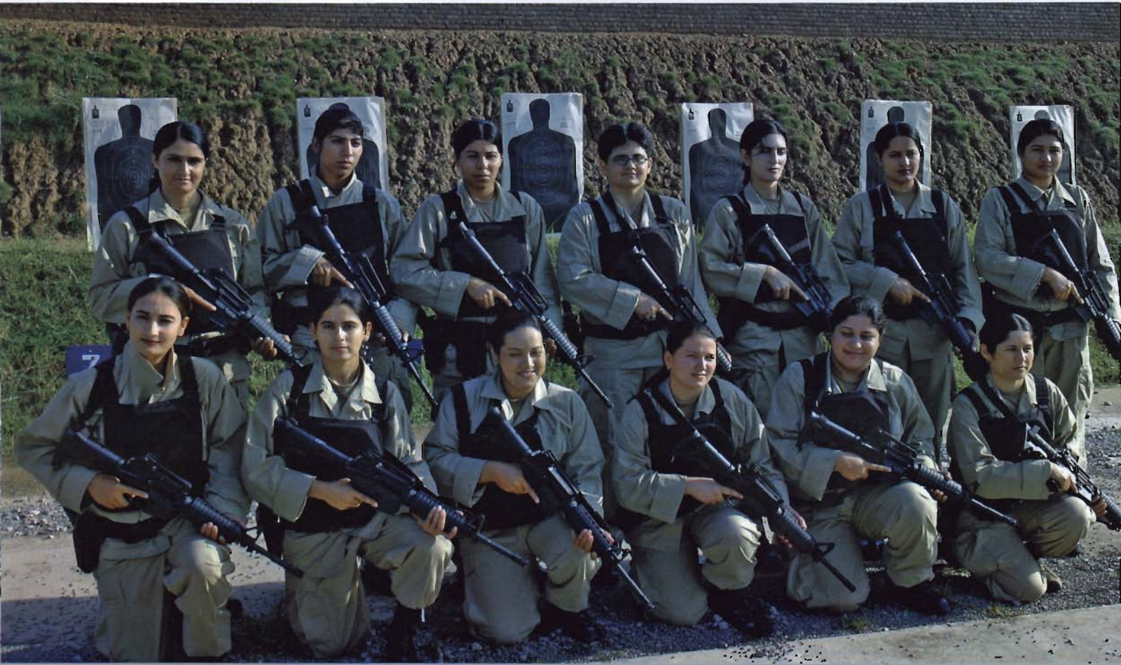
ہنگامی صورت حال سے نمٹنے کی تربیت حاصل کرنے والی خواتین کی ٹیم

اپنے آغاز سے اب تک اس پروگرام کے ذریعہ پاکستان میں 90 تربیتی کورس منعقد کئے جا چکے ہیں اور پندرہ سو سے زیادہ پاکستانی حکام اور قانون نافذ کرنے والے اہلکار یہ تربیت مکمل کر چکے ہیں۔ یہ پروگرام امریکی محکمہ خارجہ کی مالی اعانت سے چلایا جا رہا ہے اور اس کے ذریعہ پاکستان میں سلامتی کی صورت حال سے موثر انداز میں نمٹنے کے لئے تربیت، آلات اور ٹیکنالوجی فراہم کی جاتی ہے۔