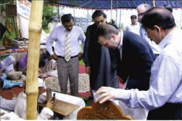
ڈینیل ایس سلوان مظفر آباد میں زلزلہ سے متاثر ہونے والے علاقوں میں بحالی و تعمیر نو کے منصوبوں کا معائنہ کر رہے ہیں۔