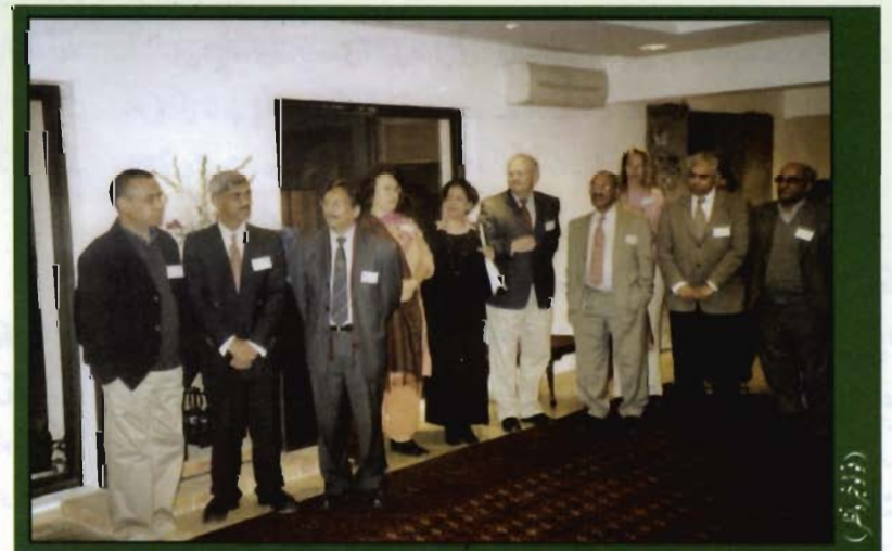
تقریب میں فل براہیٹ اور ہمفری اسکالرشپس کے سابق طالب علم

حکومت پاکستان کا ہائیر ایجوکیشن کمیشن اور یو ایس ایڈ فل براہیٹ ایچ ای سی / یو ایس ای پی ایچ ڈی پروگرام کیلئے فنڈز فراہم کرتے ہیں۔ اس پروگرام کے تحت چار سال تک کی تعلیم کیلئے امداد فراہم کی جاتی ہے اور اس میں اطلاقی سائنسز، زراعت، صحت، معاشیات، علم التعلیم اور اقتصادی ترقی کے مضامین کو خصوصی ترجیح دی جاتی ہے۔ ایسے تقریباً 50 وظائف دیئے جائیں گے۔