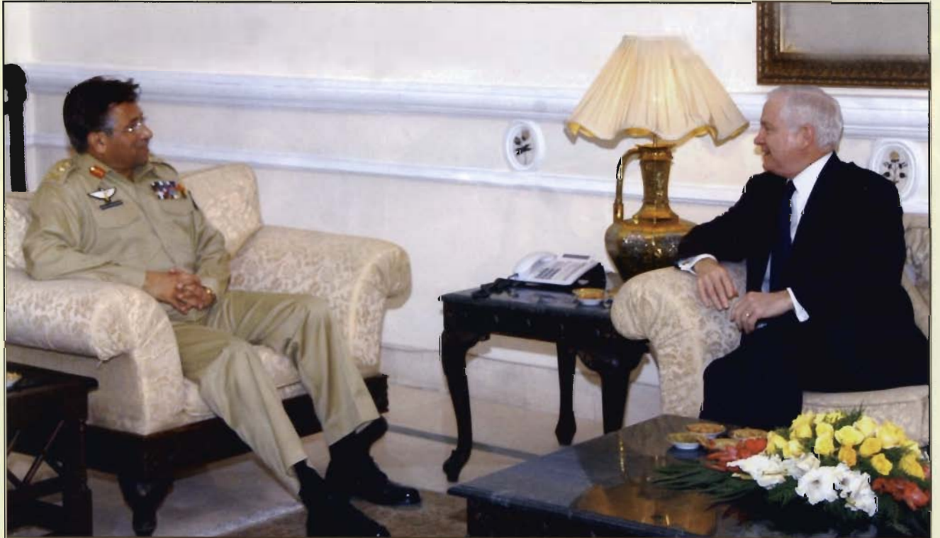
امریکی وزیر دفاع رابرٹ گئیس راولپنڈی میں صدر جنرل پرویز مشرف سے ملاقات کر رہے ہیں۔