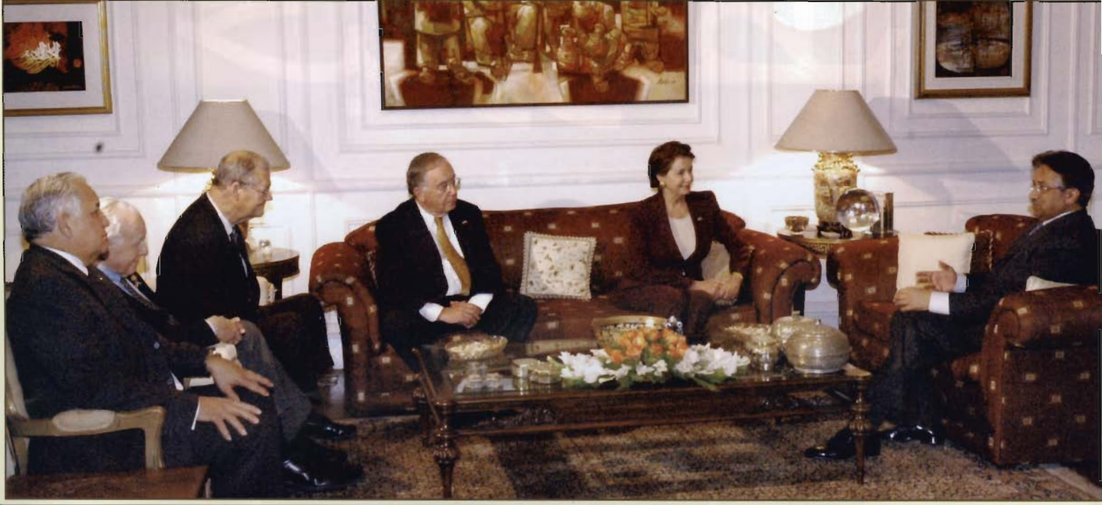
امریکی کانگریس کا ایک وفد نونٹن سٹیپیکرینسی پیلوسی کی زیر قیادت راولپنڈی میں صدر پاکستان جنرل پرویز مشرف سے ملاقات کر رہا ہے۔